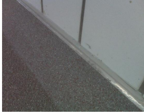
Fertige Hohlkehle mit Profil